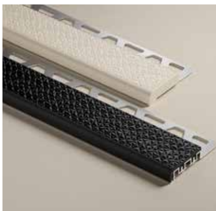
Association des coloris GS et SP (TREP-V 42/12)